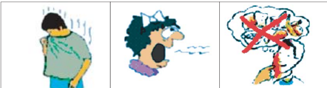
চুল ও কাপড়ে দুর্গন্ধ