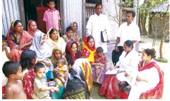
একটি কমিউনিটি কাউন্সিলিং অধিবেশন

উপকরণ : বোর্ড / পোস্টার পেপার, কলম, মাল্টিমিডিয়া