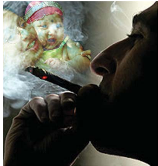
ধূমপান আপনার এবং আপনার পরিবারের জন্য সমান ক্ষতিকর

সেশনের আলোচনা থেকে অংশগ্রহণকারীরা তামাকের ক্ষতি সম্পর্কে সঠিক ও বিস্তারিত ধারণা পেয়েছে কিনা সে সম্পর্কে প্রশ্ন করবেন। যদি কারো কোনো প্রশ্ন থাকে তাহলে সেশন পরিচালনাকারী তার সংক্ষিপ্ত উত্তর প্রদানের মাধ্যমে সেশন শেষ করবেন।